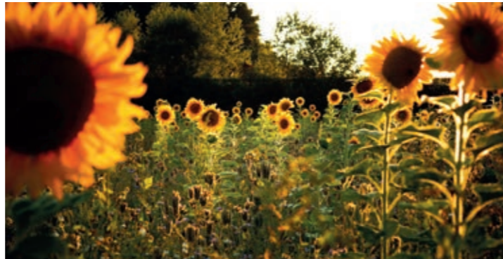
Sonnenblumen in der Hallertau

Im Kuchlbauer Turm, einem Hundertwasser-Architekturprojekt, wartet eine einzigartige Kombination aus Bier und Kunst und im KunstHausAbensberg eine umfangreiche Ausstellung über den Künstler auf Sie.