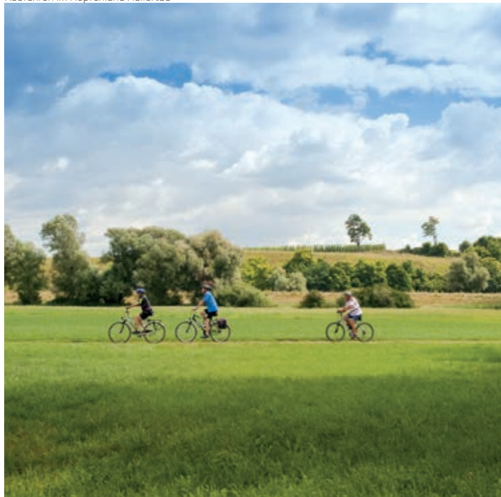
Radfahren im Hopfenland Hallertau

Nach der Querung der Abens und des Gillamoos-Festplatzes folgen Sie zunächst dem Abens-Radweg in Richtung Biburg . Entlang der sich gemächlich dahin schlängelnden Abens gelangen Sie in das Kernland der Hallertau und in das Anbaugebiet des Abensberger Qualitätsspargels – überwiegend auf wenig befahrenen Nebenstraßen mit geringen bis mittleren Steigungen.