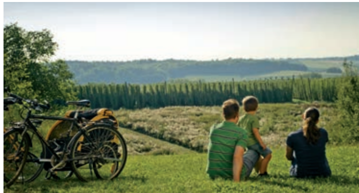
Rast mit Blick auf die Hopfengärten