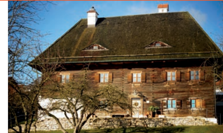
Restaurierter Stadt in Kirchdorf

warten darauf, gemeistert zu werden – auch E-Bike-Fahrer freuen sich darüber, dass es unterwegs noch einige Möglichkeiten zur erfrischenden Einkehr gibt, bevor Sie bei Offenstetten auf den Radweg in Richtung Abensberg abbiegen und zum Ausgangspunkt zurückkehren.