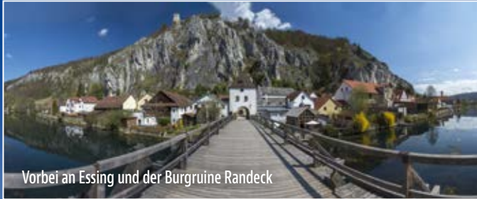
Vorbei an Essing und der Burgruine Randeck

A uf einem steil aufragenden Kalksteinfelsen über dem Altmühltal liegt die stolze Burg Prunn. Ihre majestätische Lage macht die Burg zu einer der bekanntesten Bayerns. Zudem ist sie Fundstelle der Prunkhandschrift des Nibelungenliedes. Fantastische Landschaften erwarten Sie auf dem Weg zum Luftkurort Riedenburg mit seinen romantischen Gassen und der majestätischen Rosenburg.