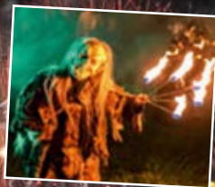
Lunch an Bord von März bis Dezember