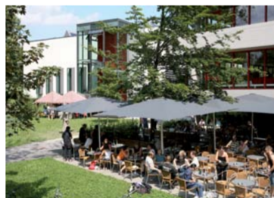
Museum Lothar Fischer, Berschneider + Berschneider, Architekten BDA, Innenarchitekten