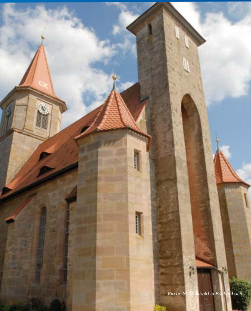
Kirche St. Willibald in Büchenbach