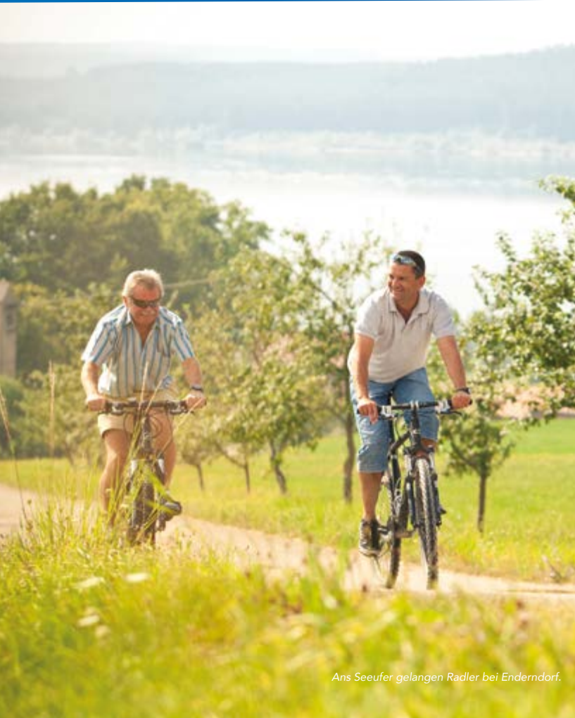
Ans Seeufer gelangen Radler bei Enderndorf.