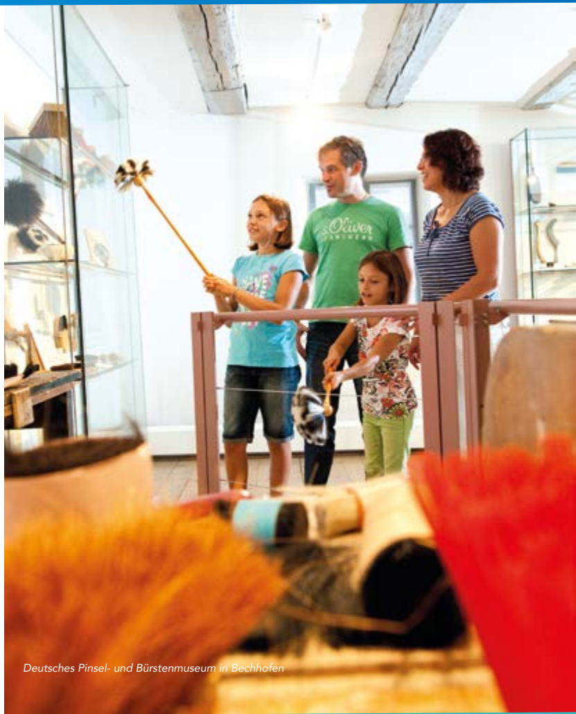
Deutsches Pinsel- und Bürstenmuseum in Bechhofen

Gemeinde Burgoberbach | Ansbacher Straße 24 | 91595 Burgoberbach | Tel. 09805 91910 | www.burgoberbach.de