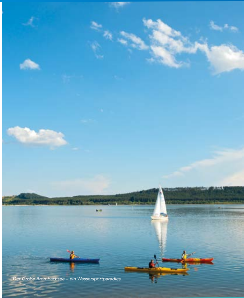
Der Große Brombachsee – ein Wassersportparadies

Gemeinde Röttenbach | Rathausplatz 1 | 91187 Röttenbach Tel. 09172 69100 | www.roettenbach.de