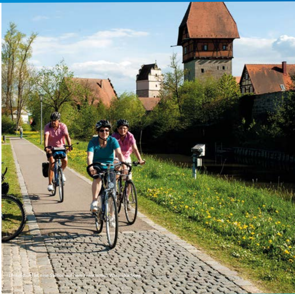
Dinkelsbühl ist eine Station auf dem Fränkischen WasserRadweg.

Koppengasse 10, 91550 Dinkelsbühl Tel. 09851 5556-417, info@jhb-dinkelsbuehl.de