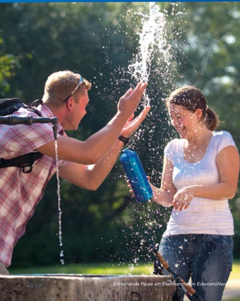
Erfrischende Pause am Eisenhammer in Eckersmühlen