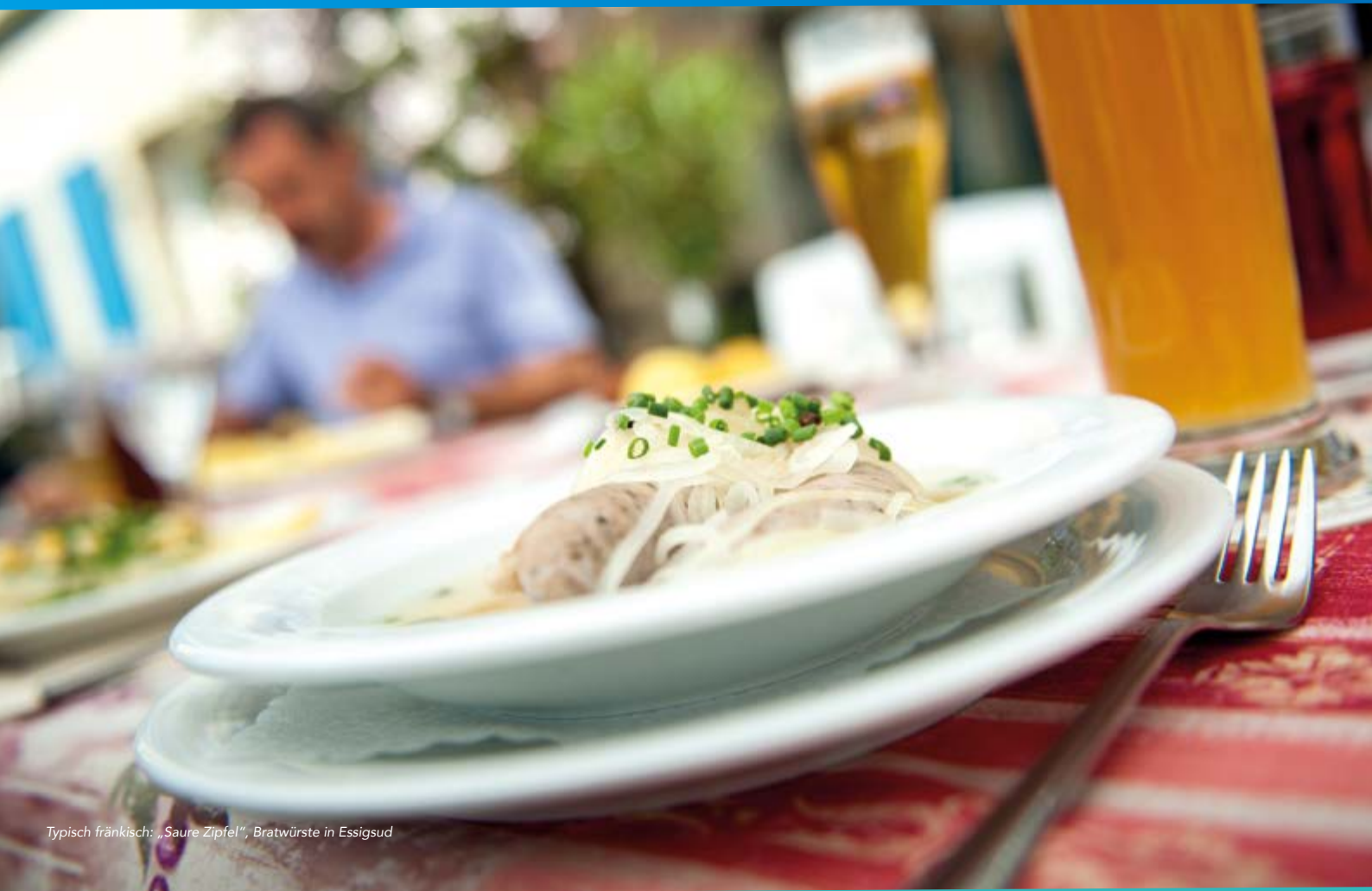
Typisch fränkisch: „Saure Zipfel“, Bratwürste in Essigsud