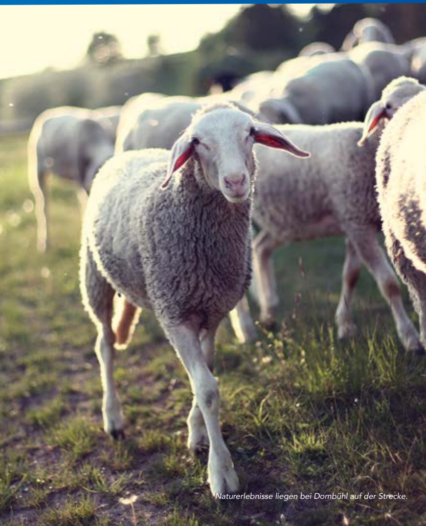
Naturerlebnisse liegen bei Dombühl auf der Strecke.