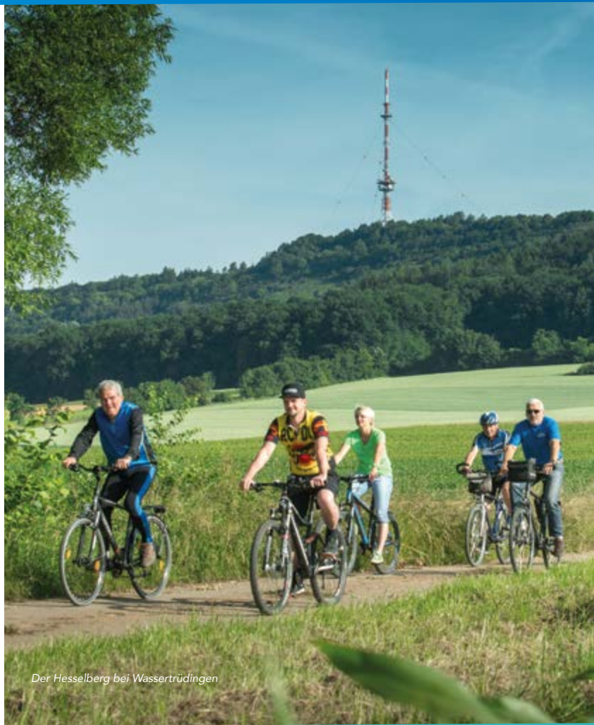
Der Hesselberg bei Wassertrüdingen

Gemeinde Unterschwaningen c/o Touristikverband Hesselberg | Aufkirchen 50 91726 Gerolfingen | Tel. 09854 979778 | www.hesselberg.de