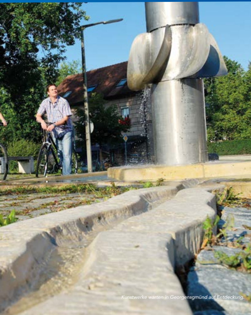
Kunstwerke warten in Georgensgmünd auf Entdeckung.