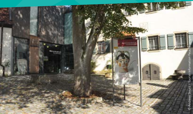
Historische Altstadt von Dinkelsbühl (linke Seite), Fränkisches Museum Feuchtwangen

Nach Überquerung der Sulzach folgt man dem Flussverlauf aus der Stadt heraus und anschließend weiter Richtung Norden. Oberdallersbach, Rödenweiler und Vehlberg liegen an der Strecke. Nun geht es durch das Gebiet der Gemeinde Dombühl , zu der Kloster Sulz gehört. Durch den Wald nähern die Radler sich schließlich der Stadt Schillingsfürst , über der weithin sichtbar das gleichnamige Barockschloss thront.