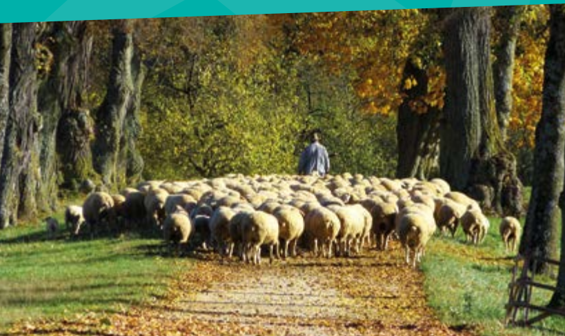
Radler vor der Merkendorfer Stadtmauer (linke Seite), Schäfer bei Weidenbach

In Dennenlohe haben die Radler die Wahl: Sie können dem Fränkischen WasserRadweg ans Ufer des Dennenloher Sees und weiter zum Altmühlsee oder nach Wassertrüdingen und ins Romantische Franken folgen.