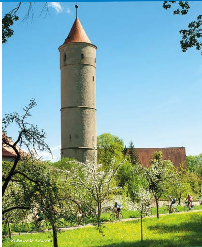
Radler bei Dinkelsbühl

Markt Schopfloch | Friedrich-Ebert-Str. 15 | 91626 Schopfloch Tel. 09857 97950 | www.schopfloch-mittelfranken.de