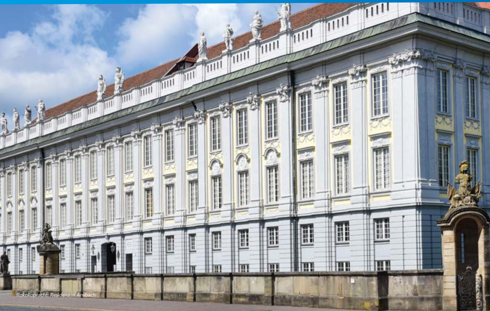
Rokokopracht: Residenz in Ansbach