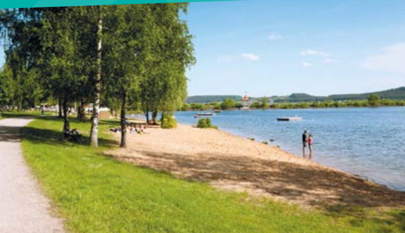
Pause am HopfenBierGut in Spalt (linke Seite), Badestrand am Igelsbachsee

In Enderndorf beginnt auch die Zwischenroute 3. Bei dieser Variante folgt man einfach dem Radweg am Ufer des Großen Brombachsees in östlicher Richtung. Nach vier Kilometern ist Allmannsdorf erreicht. Von dort geht es auf dem Fränkischen WasserRadweg entweder Richtung Pleinfeld oder Richtung Röttenbach weiter.