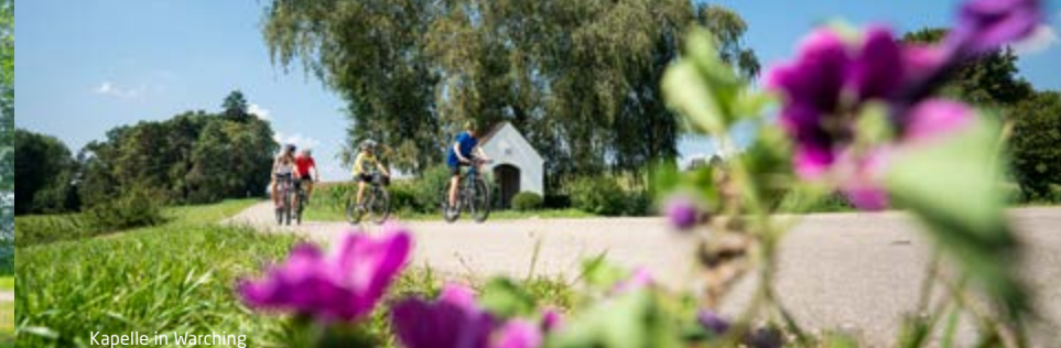
Kapelle in Warching