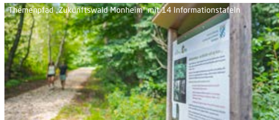
Themenpfad „Zukunftswald Monheim“ mit 14 Informationstafeln

Merkwürdige Mulden oder Bäche, die plötzlich vom Erdboden verschluckt werden: Faszinierende geologische Phänomene warten auf der Monheimer Alb auf Entdeckung. Zwei kurzweilige Lehrpfade vermitteln Wissenswertes rund um typische Karsterscheinungen. Auf dem Dolinenlehrpfad, einem 9 Kilometer langen Rundweg zwischen Rögling und Tagmersheim, findet man heraus, wie die ovalen Mulden in der Landschaft entstehen.