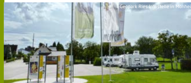
Geopark Ries Infostelle in Monheim

Später bauten die Römer Straßen und Gutshöfe in der Monheimer Alb, deren Spuren heute bei Wolferstadt zu entdecken sind.