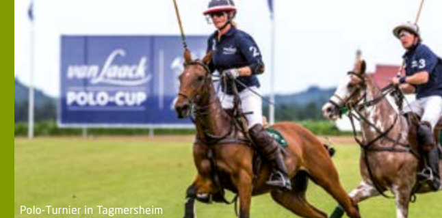
Polo-Turnier in Tagmersheim

Von Angeln bis Nordic Walking, von Bogen- schießen bis Kneippen: Die Monheimer Alb bietet Freizeitspaß für jeden Anspruch.