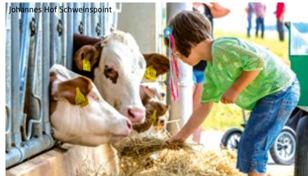
Johannes Hof Schweinspoint

Viel Wissenswertes erfährt man am Lehrbienenstand mit Bienenweide und an der Fischereilehrhütte in Monheim. Auch ein Besuch im Kreislehrgarten Monheim lohnt sich. Hier wachsen nicht nur Kräuter, Obst und Gemüse; ein Trockenbiotop und eine Teichlandschaft präsentieren Pflanzen, die sich an einen speziellen Lebensraum angepasst haben.