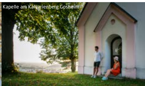
Kapelle am Kalvarienberg Gosheim