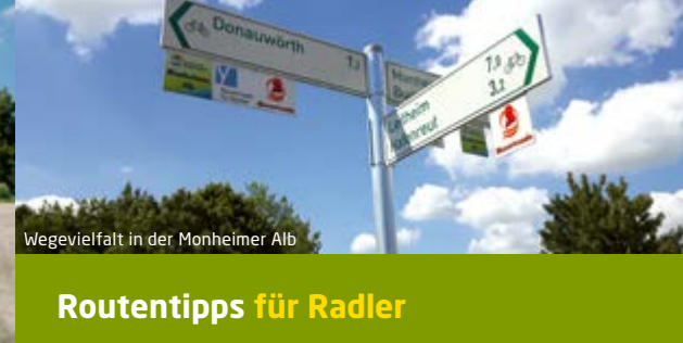
Wegevielfalt in der Monheimer Alb

Radler erkunden die Monheimer Alb auf entspannten Touren. Bei der Fahrt durch die abwechslungsreiche Naturlandschaft ist der Weg das Ziel!