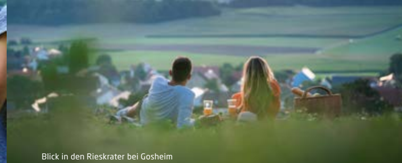
Blick in den Rieskrater bei Gosheim