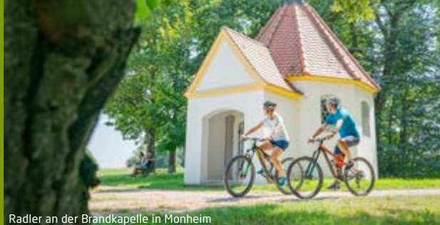
Radler an der Brandkapelle in Monheim