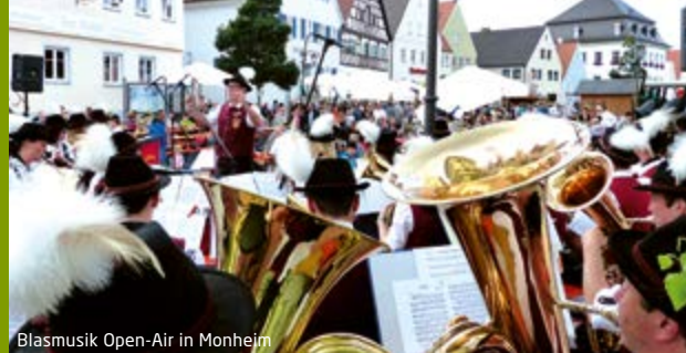
Blasmusik Open-Air in Monheim