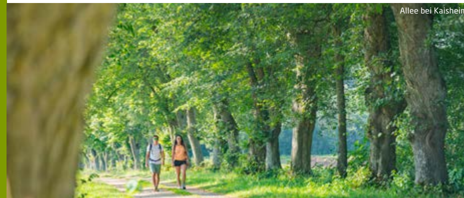
Allee bei Kaisheim