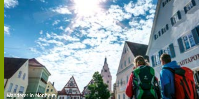
Wanderer in Monheim

In der Monheimer Alb trifft alles zusammen: Schwaben, Franken und Altbayern, Naturpark Altmühltal, Ferienland DONAURIEN und UNESCO Global Geopark Ries, natürliche Ruhe, spannende Geschichte und lebendige Tradition.