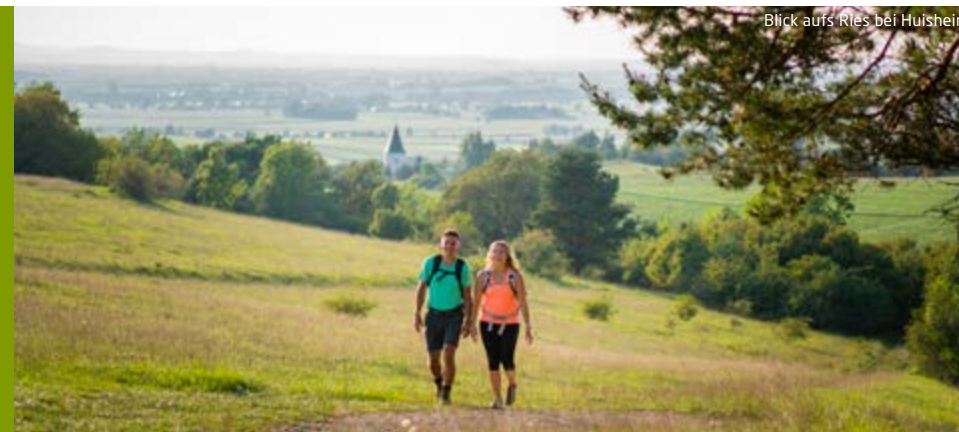
Blick aufs Ries bei Huisheim