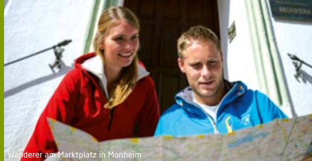
Wanderer am Marktplatz in Monheim