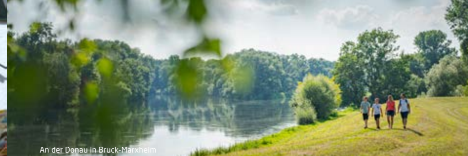
An der Donau in Bruck-Marxheim