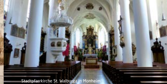
Stadtpfarrkirche St. Walburga in Monheim