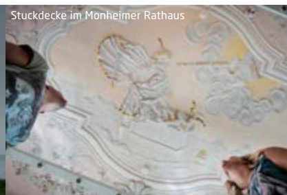
Stuckdecke im Monheimer Rathaus