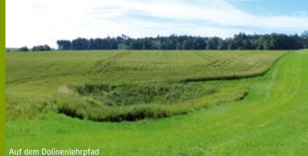
Auf dem Dolinenlehrpfad