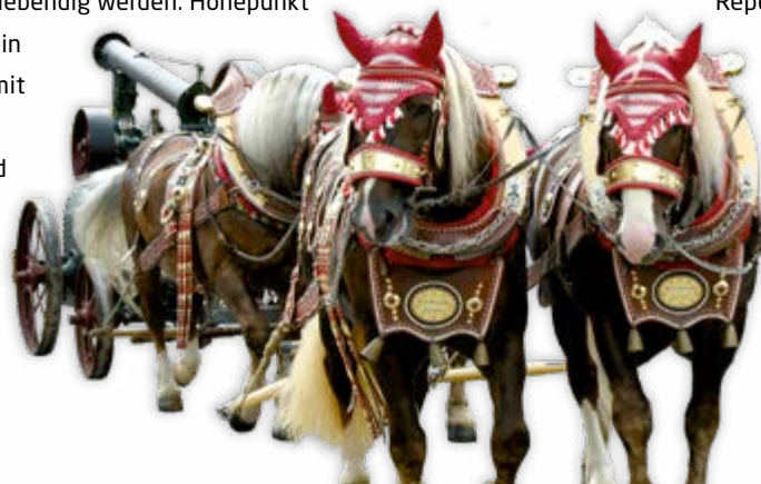
Historisches Stadtfest in Monheim (rechts)

Gaukler und Landsknechte, Marketenderinnen, Handwerker und Edelleute tummeln sich auf Monheims Straßen: Beim Historischen Stadtfest lässt das Jurastädtchen die Vergangenheit lebendig werden. Höhepunkt des Festes ist ein großer Umzug mit verschiedenen Fuhrwerken und Fußgruppen. Dieses Spektakel veranstaltet Monheim im