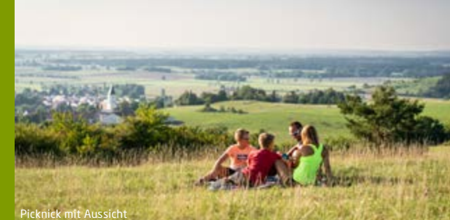
Picknick mit Aussicht

Was sind eigentlich Dolinen? Wie sieht der Wald der Zukunft aus? Und was machte Martin Luther in Monheim? Unterhaltsame Lehrpfade beantworten diese und viele weitere Fragen.