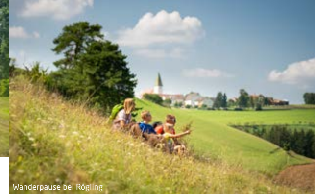
Wanderpause bei Rögling

20 abwechslungsreiche Rundwanderwege, spannende Lehrpfade und traditionsreiche Pilgerstrecken: Es gibt viele Wege, die Monheimer Alb zu entdecken.