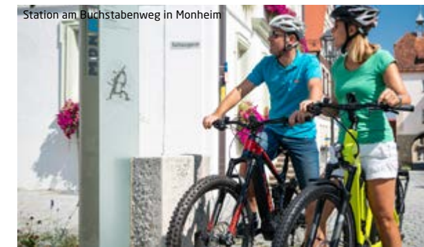
Station am Buchstabenweg in Monheim

Wer weiter radeln möchte, findet Anschluss an beliebte Fernradwege. Im Süden der Monheimer Alb verlaufen zum Beispiel der Donau-Radweg und der Radweg Romantische Straße. Über Treuchtlingen erreicht man den Altmühltal-Radweg.