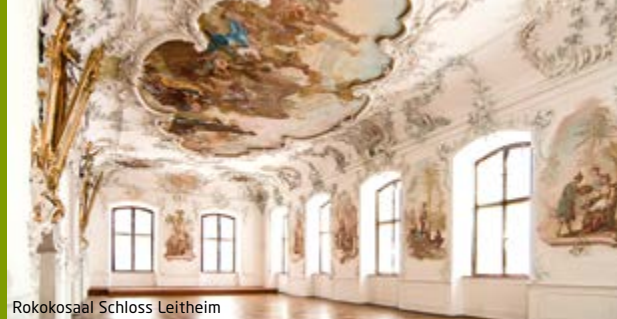
Rokokosaal Schloss Leitheim