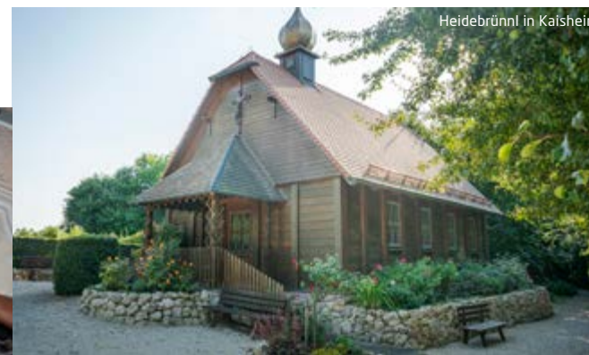
Heidebrünnl in Kaisheim