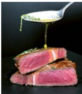
Das Restaurant by Ferber

Gemeinde Daiting - Tel. 09091/834 www.daiting.eu