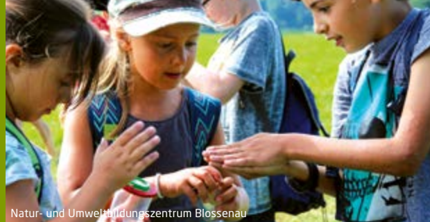
Natur- und Umweltbildungszentrum Blossenau